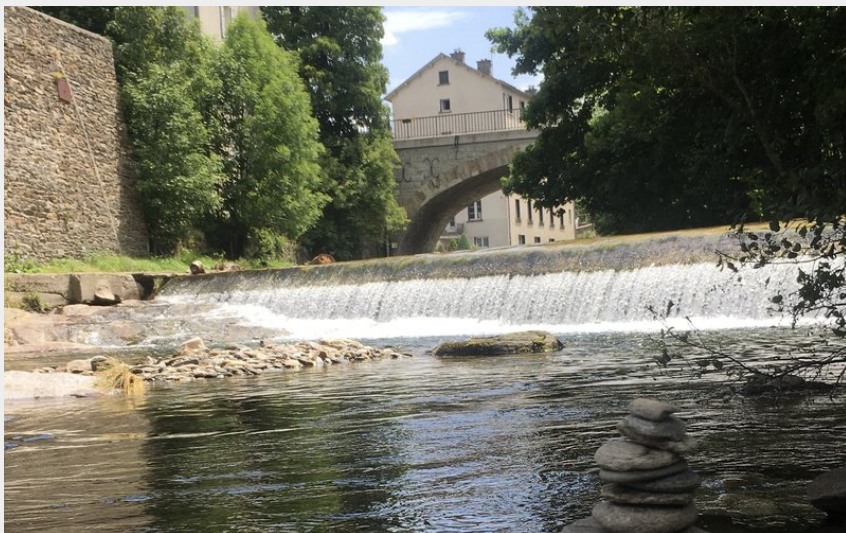
Lot, Bagnols-les-Bains (OT Mont-Lozère)