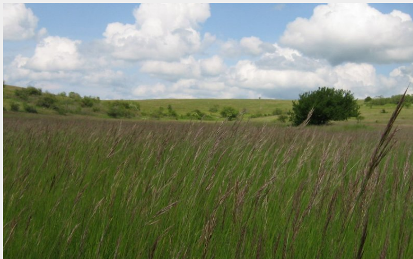
Paysage Causse de Sauveterre