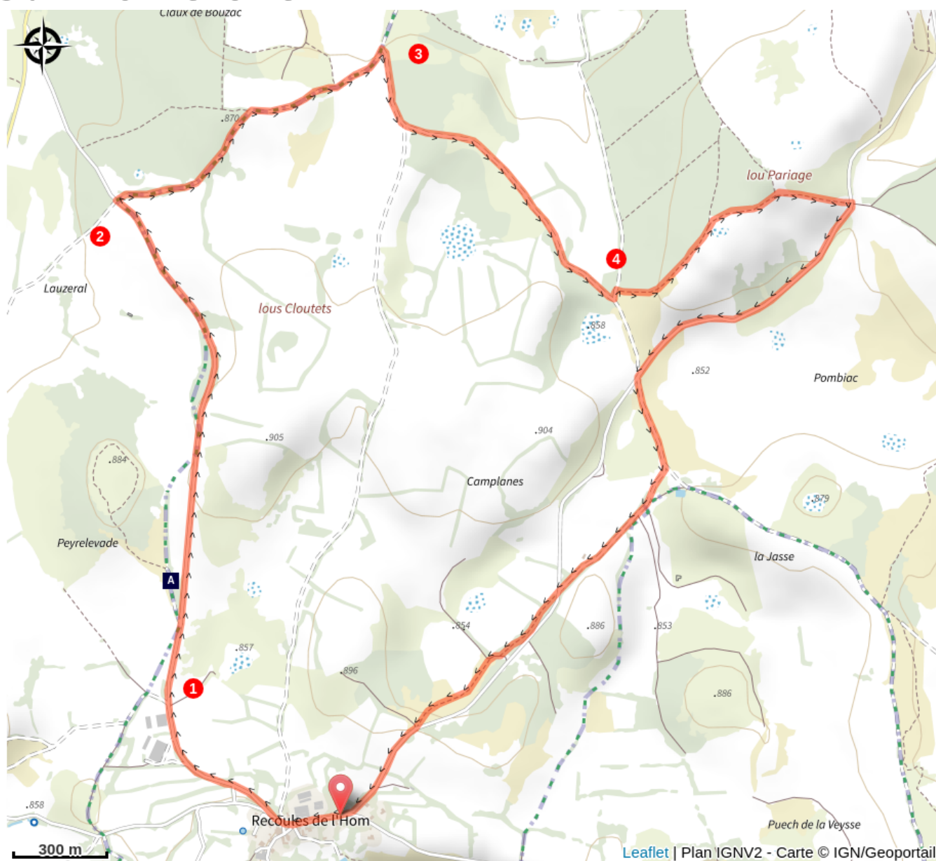
Dolmen de Peyrelevade (A)