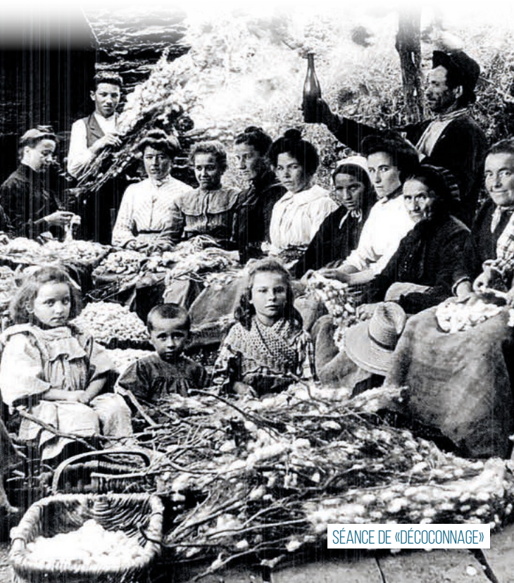
SÉANCE DE «DÉCOCONNAGE»

Magnaneries, muriers, vous retrouverez tout au long de ce sentier des témoignages de l'époque prospère de la sériciculture. Grandes bâtisses en pierre, c'est dans les magnaneries que les vers à soie étaient élevés. Les mûriers représentaient la nourriture principale de ces petits animaux qui servaient à les engraisser. Le saviez-vous ? Pour 45 grammes de graine (les œufs du ver à soie), il fallait ramasser plus de 2 tonnes de feuilles ! Des saisonniers étaient employés exprès afin de pouvoir ramasser les feuilles à l'avance. Cela représentait un mois de travail ! Ainsi, les feuilles de muriers ne devaient pas être données mouillées aux vers. Après avoir tissé leurs cocons d'un seul long fil de soie, ces derniers étaient ramassés 8 jours après avant l'éclosion de la chrysalide. Ils étaient revendus permettant une certaine aisance.