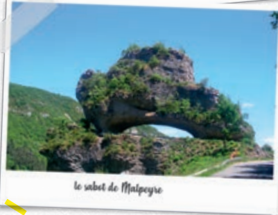
le sabot de Malepeyre

Etrange, ce rocher qui surplombe la Vallée de l'Urugne. Avec sa hauteur vertigineuse et sa forme unique, il est l'objet de nombreuses légendes. Surnommé le « Sabot de Malepeyre », (Malepeyre : mauvaise pierre), on raconte que Gargantua de passage à La Canourgue, aurait oublié sa chaussure.