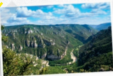
le Point Sublime

Qu'il porte bien son nom, le Point Sublime ! C'est bien le plus beau point de vue des Gorges du Tarn. Sous nos pieds, le Cirque des Baumes, réputé chez les grimpeurs. En face, au premier plan, les falaises des Gorges encerclent le Tarn. En arrière-plan, le sauvage Causse Méjean. Et au-dessus de nos têtes, une horde de vautours qui semblent nous épier.