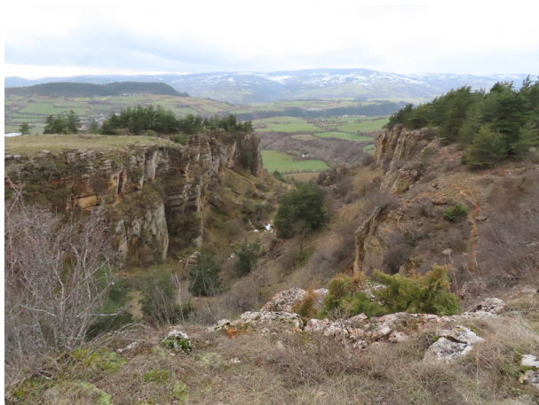
La Montagne fendue