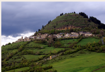
Le village au pied du Truc de Grèzes

cette époque car elles ont été détruites sous Richelieu. C'est en 1632 qu'un massif bâtiment carré à quatre étages fut construit. Celui-ci est aujourd'hui à moitié en ruines avec son unique tour d'angle qui contient l'escalier à vis. Les autres ont été démolies pendant les Guerres de Religion.