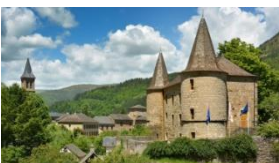
Empreintes du Temps