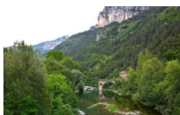
Les Jardins de la Jonte

Hameau des Douzes - Chapelle Saint-Gervais