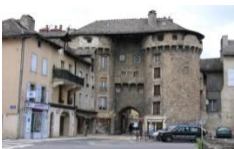
Château de la Baume