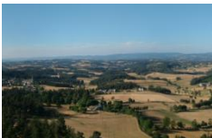
Roc de Peyre