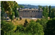
Terre de Peyre