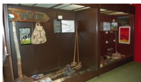
Maison de la Châtaigne

Le Pont-de-Montvert - Maison du Mont Lozère