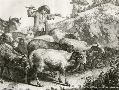
Musée d'histoire, ville de Genève