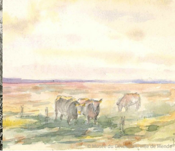
Musée du Gévaudan, ville de Mende