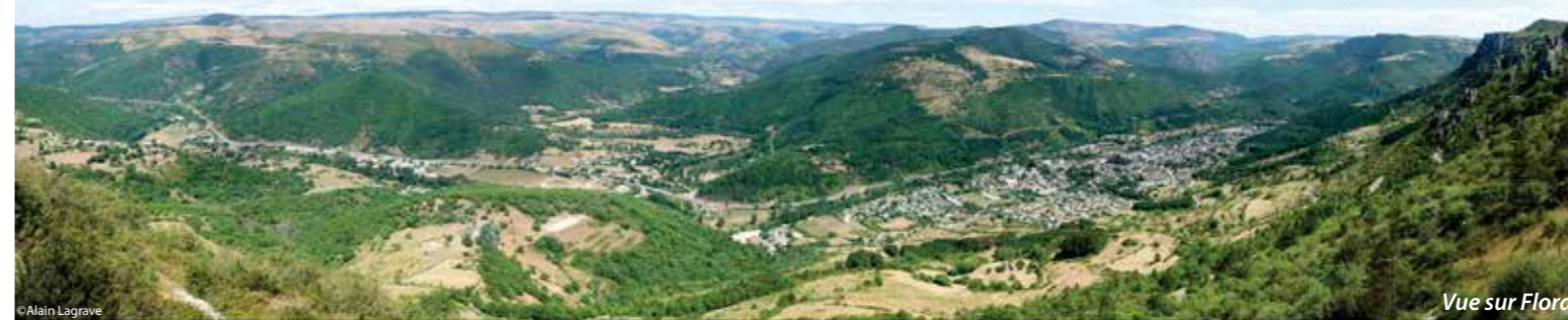
Vue sur Florac

Des rives du Tarn à la source du Pêcher en passant par le Château, nous vous invitons à découvrir la ville et son histoire tourmentée de bastion protestant.