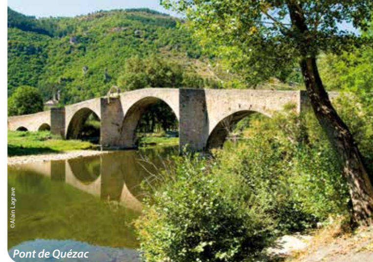
Pont de Quézac