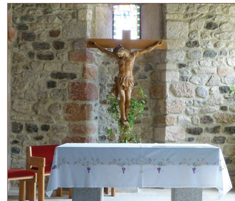
Intérieur de l'église Saint-Julien