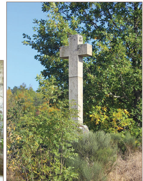
La croix de Brély