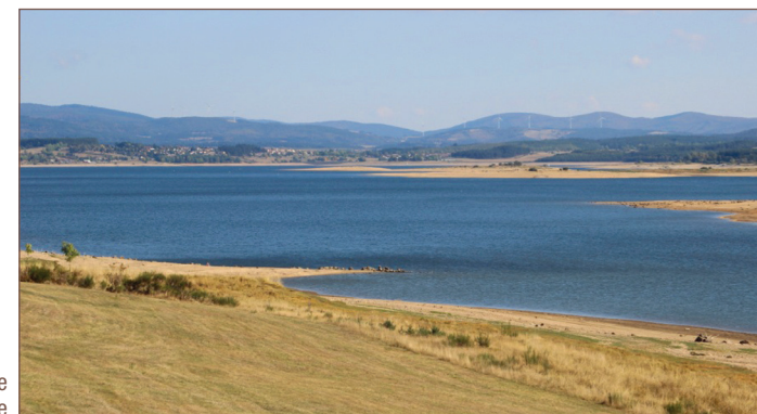
Vue depuis la croix de la Pierre Blanche