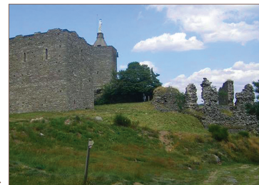
Les ruines du château de Luc

• Comité Lozère : www.comitedepartementaldelarandon-nepedestredelozerecdrp48.com