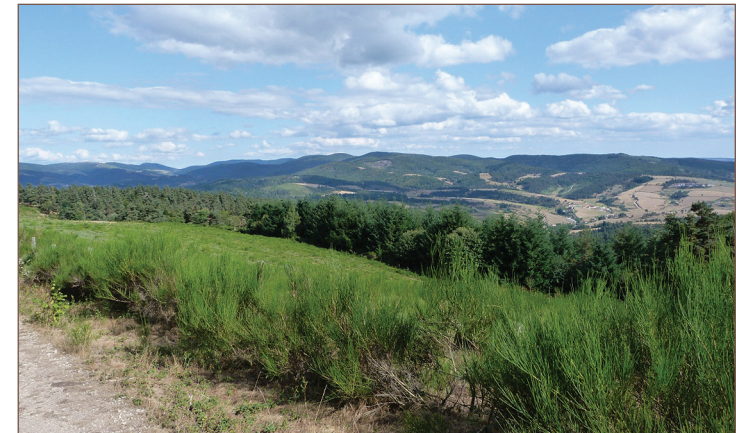
Point de vue sur le Circuit du château