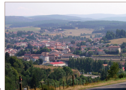
Langogne, quartier de la gare

• Comité Lozère : www.comitedepartementaldelarandon-nepedestredelozerecdrp48.com