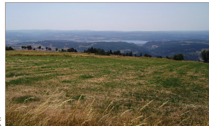
Vue sur le lac de Naussac et la Margeride