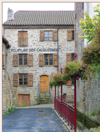
La filature des Calquières

À Langogne, le travail du bois était également prospère ainsi que la meunerie. Aujourd'hui, les constructions métalliques, la fabrication de béton, les bois imprégnés, un marché hebdomadaire et les commerces maintiennent une activité.