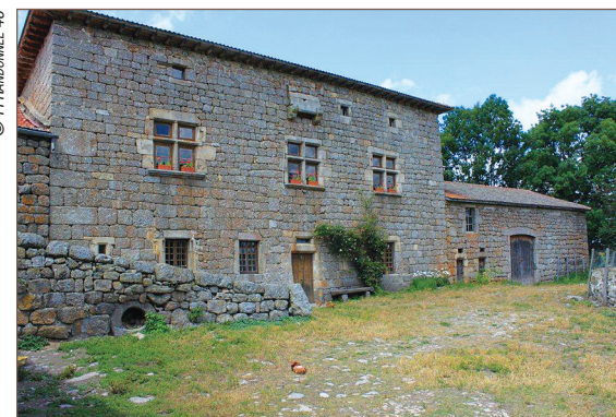
Manoir de Fontfreyde