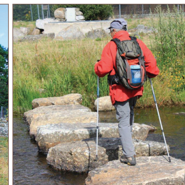
Passage de gué aux Moulins