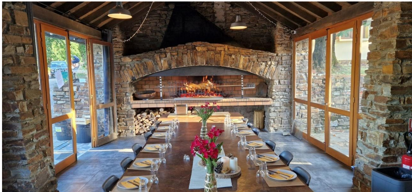
La salle, configuration 20 couverts

Capacité de la rôtissoire = un cochon de 8 - 10 kg à deux cochons de 15 kg – 20 à 60 personnes