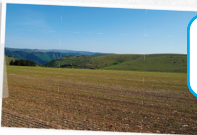
le causse de Sauveterre