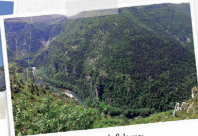
Panorama de Cabrunas