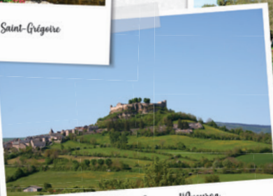
le château de Sévérac d'Aveyron