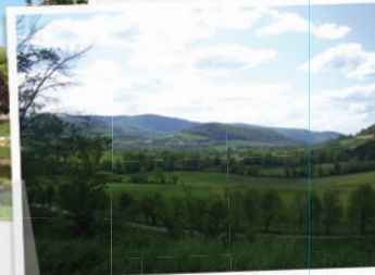
la vallée de l'Olup