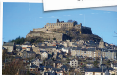
le château de Sévérac d'Aveyron