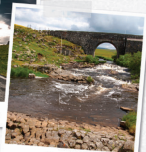
Le pont des Nègres