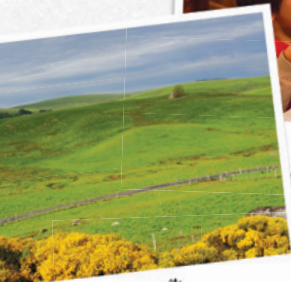
l'Aubrac et ses genêts