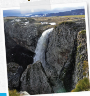
la cascade du Déroc