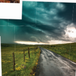
le plateau de l'Aubrac