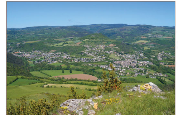
Bourgs-sur-Colagne depuis le Truc de Saint-Bonnet