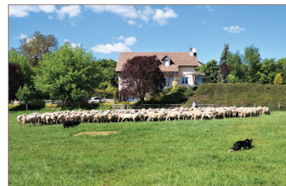
Berger rassemblant son troupeau avec l'aide de ses chiens

10 Suivre la route à droite. Ignorer une route à gauche avant Coulomb. Plus loin, traverser Fournens [👁 > site d'un autre élevage ovin laitier]. À la sortie du hameau, la route fait un lacet, puis descend rapidement jusqu'au ruisseau de Romardiès, le franchit sur un pont puis remonte en sinuant jusqu'aux Bories. Au carrefour à l'entrée du village, ignorer la route à gauche et la route à droite qui descend. Monter en face la rue et rejoindre le point de départ [👁 > au centre du village, nombreuses constructions voutées, église restaurée].