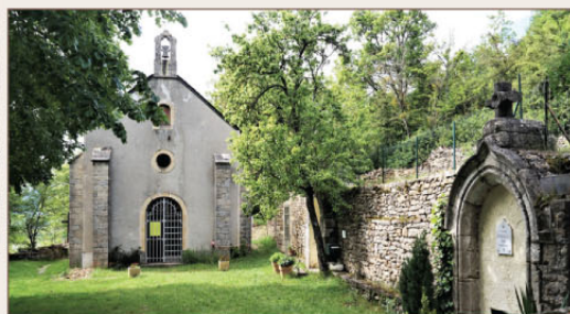
Chapelle et fontaine de Sainte-Thècle

est assez fréquente dans le Massif central. Une légende raconte que Thècle aurait traversé les mers pour fuir les persécutions. Arrivée en Gaule, elle aurait franchi les Cévennes pour s'installer dans ces montagnes. Elle serait alors morte et aurait été enterrée près de la fontaine qui porte son nom. Cette chapelle est l'objet d'un pèlerinage qui a lieu chaque année.