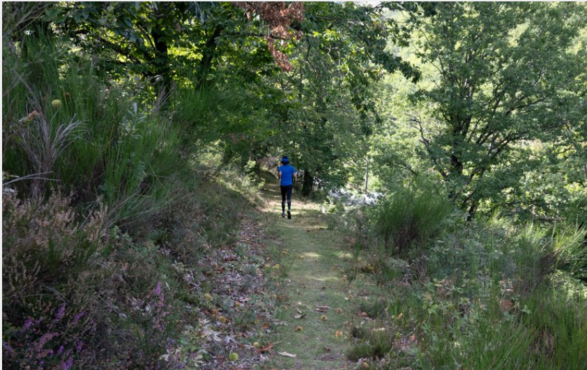
Sentier trail