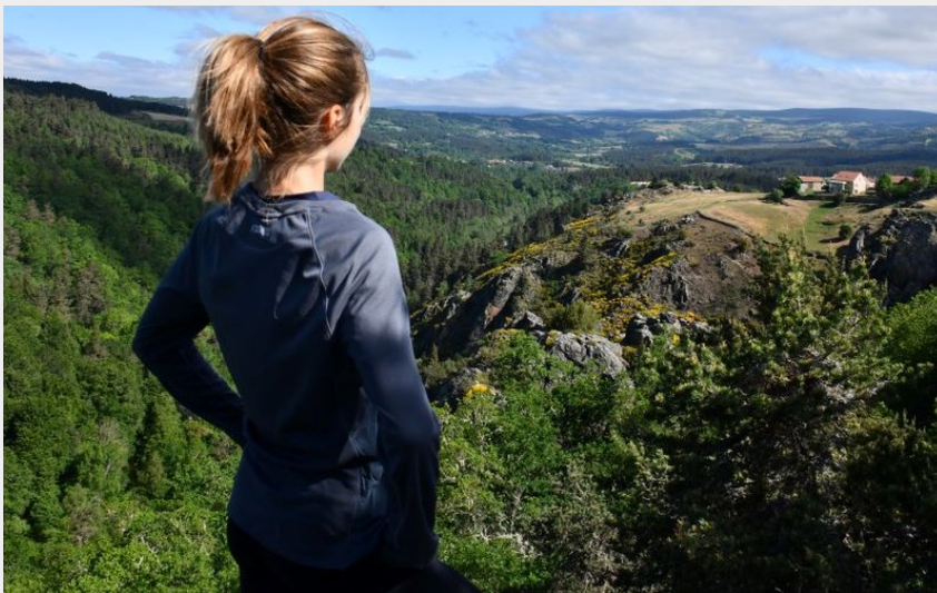
Pause contemplation