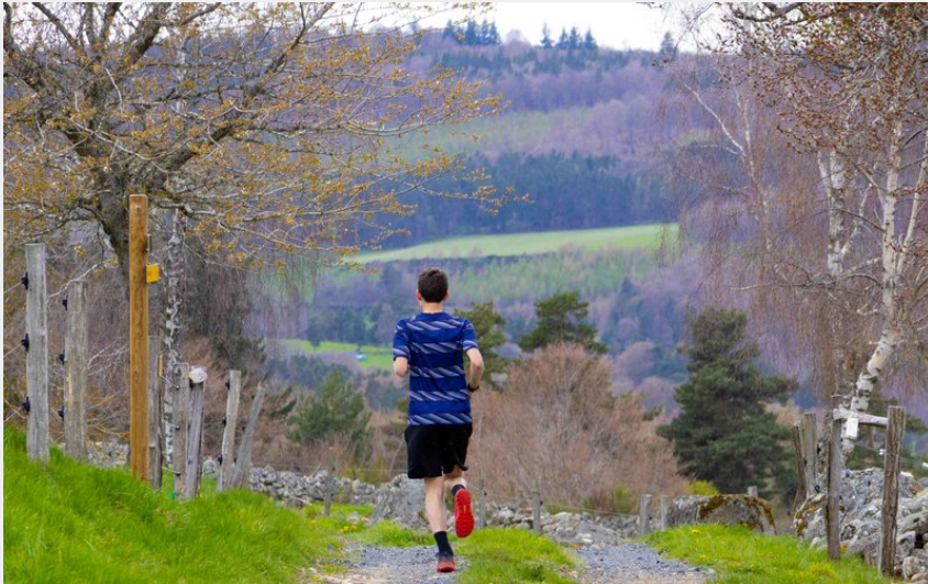
Traileur vers la ferme d'Aussets