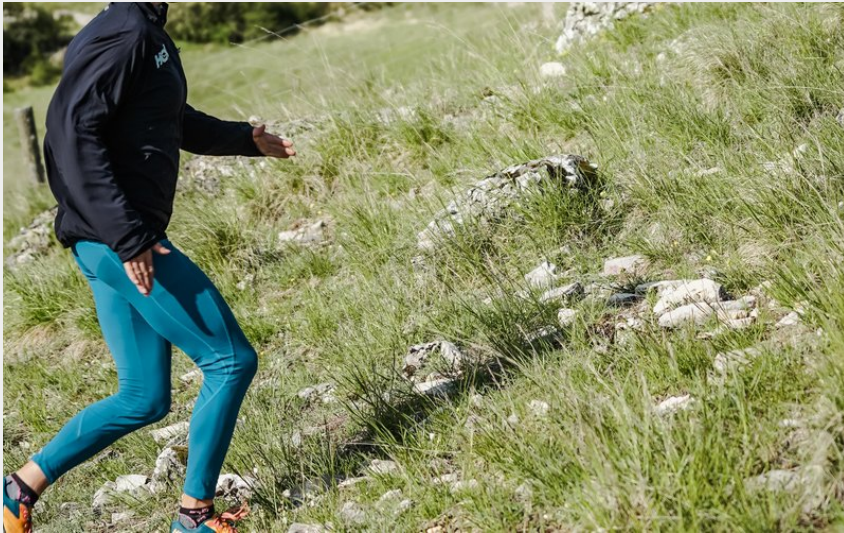
Traileur en montée