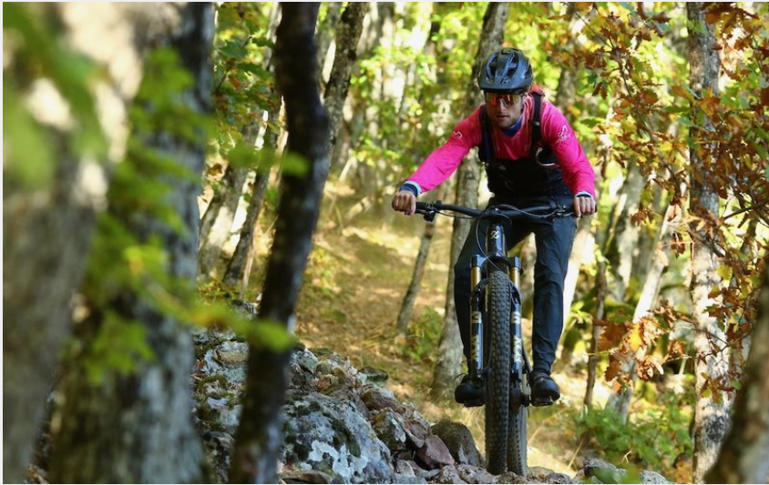
Dans la forêt automnale