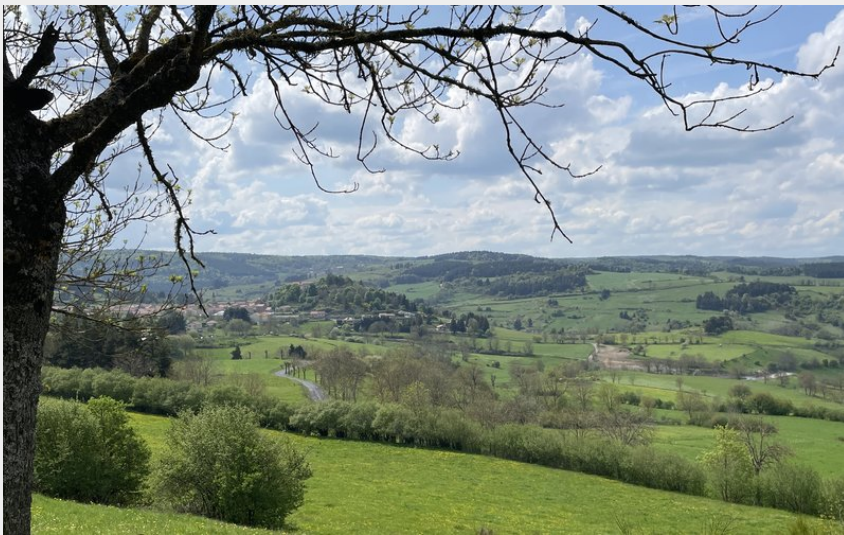
Vue sur Chambon le Château