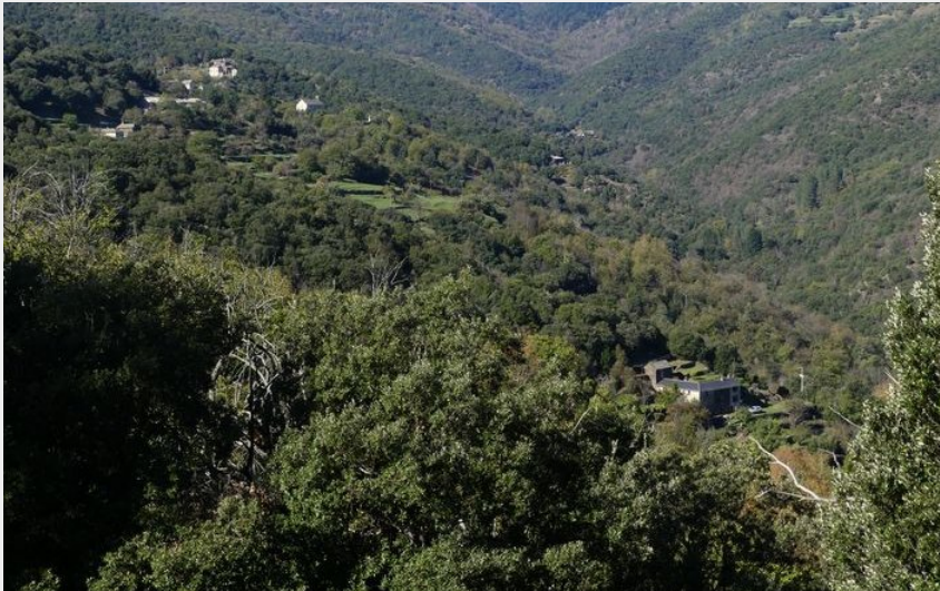
Saint Martin de Lansuscle (nathalie.thomas)