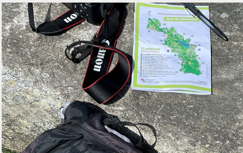
L'équipement du randonneur contemplatif (CCHA)