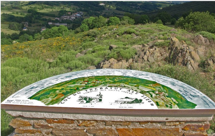
La vue panoramique depuis le col du Trébatut