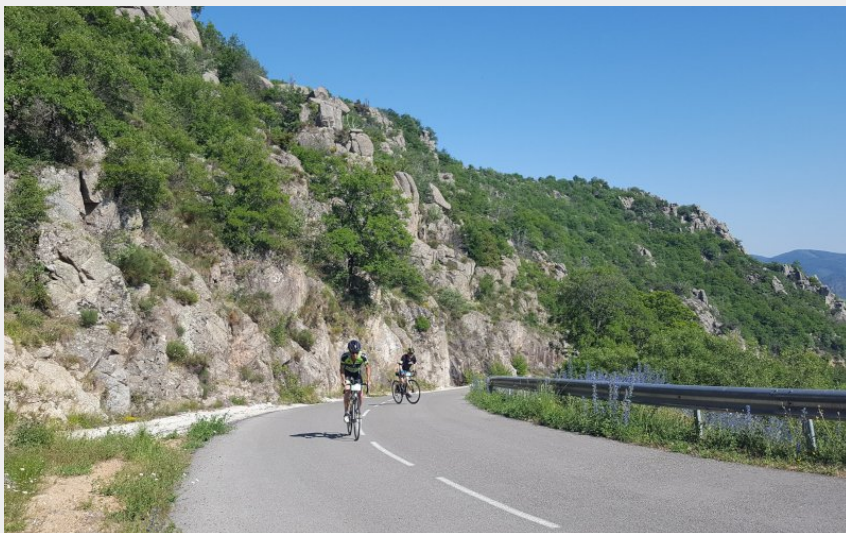
Boucle cyclo du Tour du Finiels