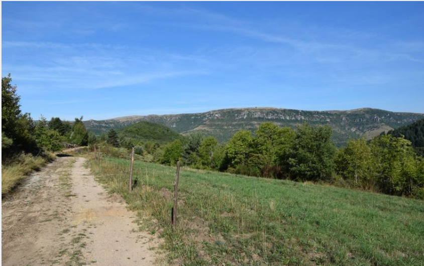
Vue sur le causse Méjean (Florac - Sud Lozère)