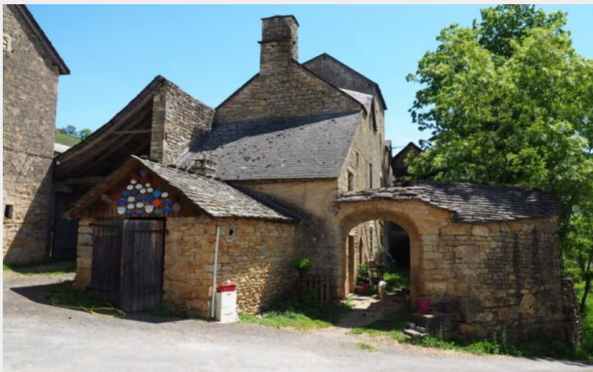
Un des hameaux sur le Truc de Saint-Bonnet