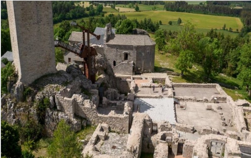
Tour d'Apcher