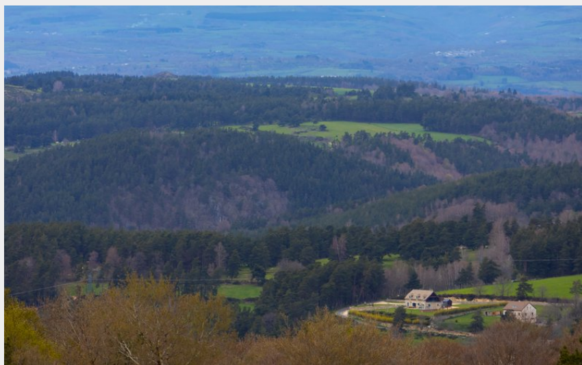
Point de vue sur le Plomb du Cantal (OT Aubrac Lozérien)