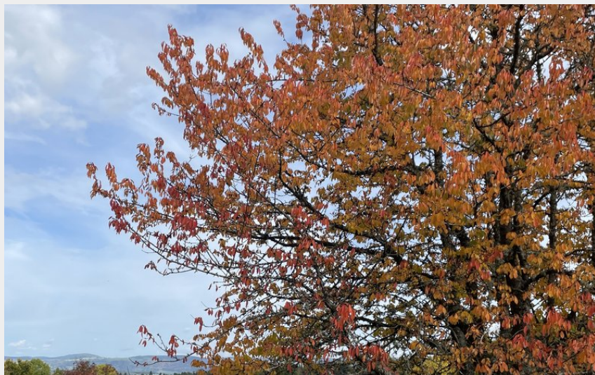
Margeride en automne