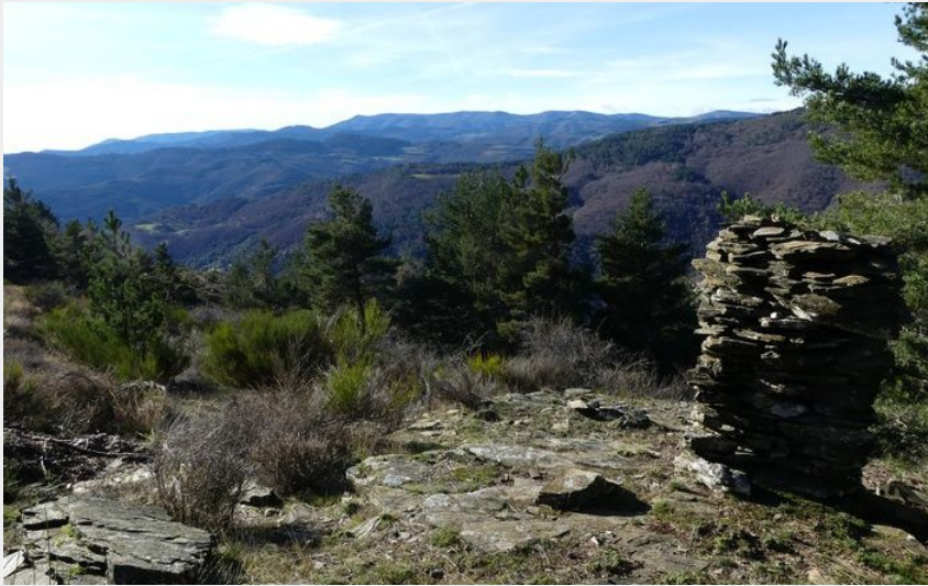
Vue sur l'Aigoual (nathalie.thomas)