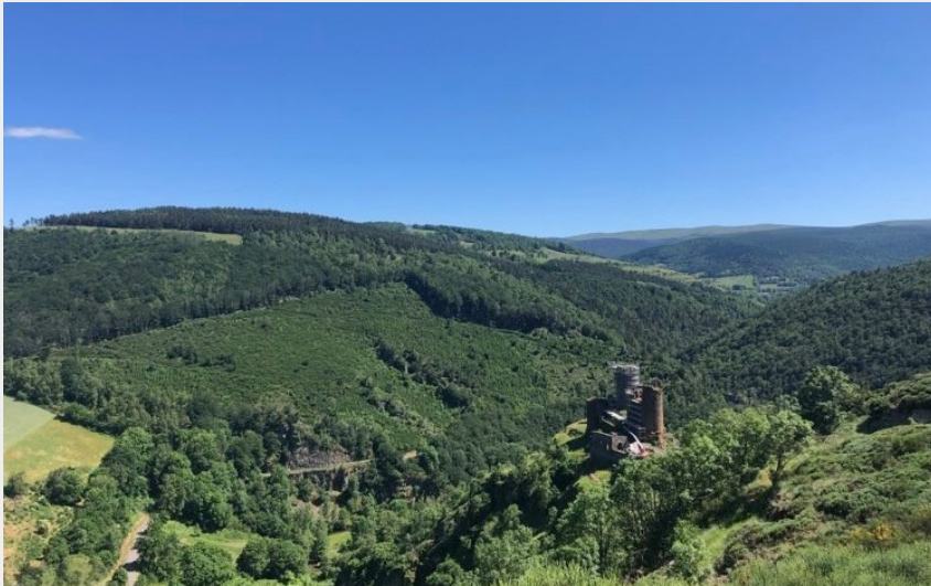
Château du Tournel