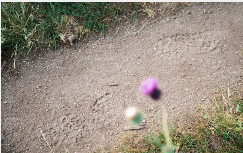
(SMAML PPN Antonin Michaud Soret Ahstudio)