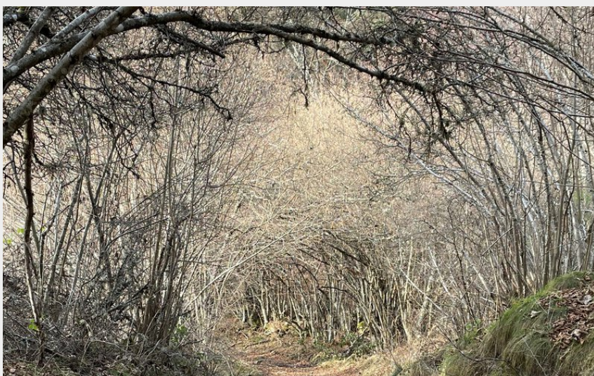
Cheminement entre les murs de pierres (CCHA)