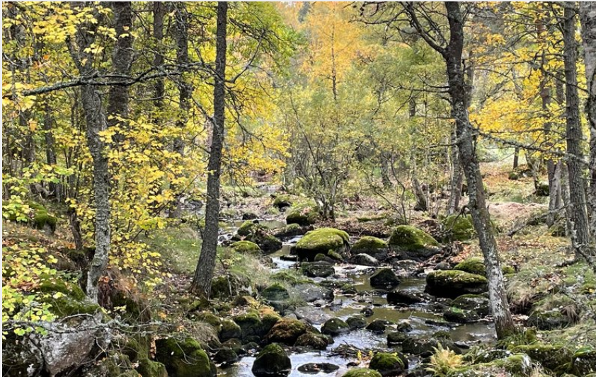
Le ruisseau de la Clamouse à Chastanier