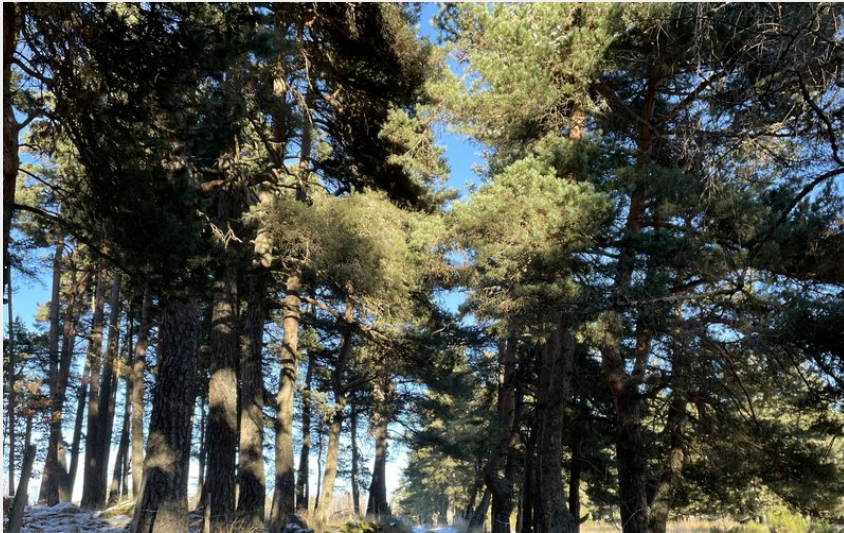
Traversée en sous bois