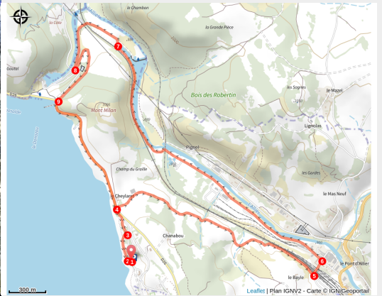
Panoramique des circuits VTT au départ de l'itinéraire