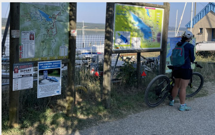
Panoramique VTT au départ du circuit (CCHA)