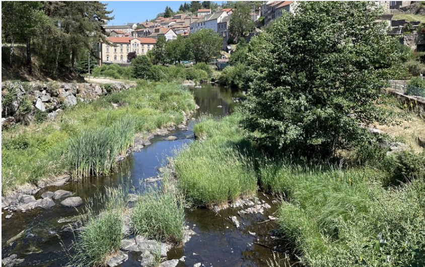
Le Chapeauroux dans la traversée d'Auroux