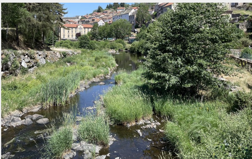
Le Chapeauroux dans la traversée d'Auroux (CCHA)