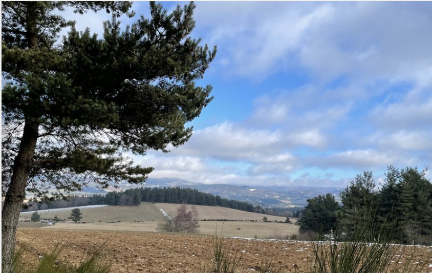
Vue sur le département de l'Ardèche depuis l'itinéraire