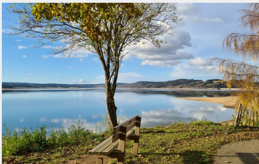
Prendre le temps sur le chemin