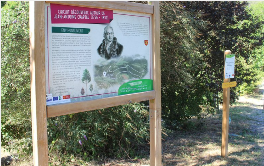
Départ du sentier d'interprétation sur Jean-Antoine Chaptal (FS - OTI Mende)