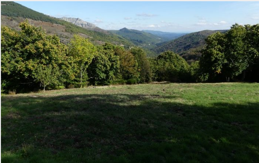
Vue sur le Luech (Nathalie Thomas)